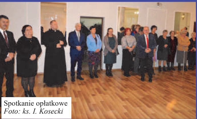
Spotkanie opłatkowe