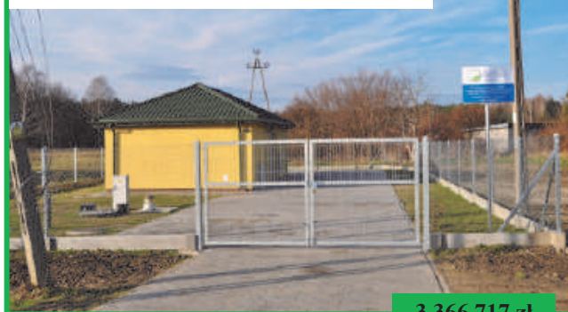
Rozbudowa przepompowni ścieków i sieci kanalizacyjnej w Milejowicach