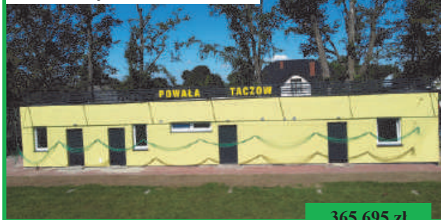
Modernizacja szatni w Taczowie