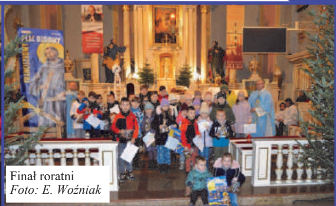
Finał roratni