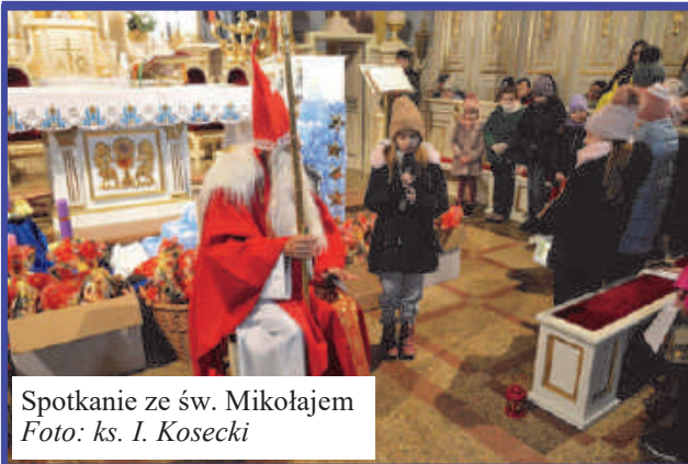
Spotkanie ze św. Mikołajem